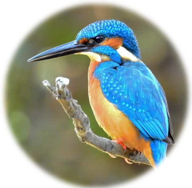
Alcedo atthis (Pescărelul albastru)

Situl a fost declarat pentru protecția 25 de specii de păsări prevăzute la articolul 4 din Directiva 2009/147/CE și în anexa II la Directiva 92/43/CEE printre care: acvila de munte, viesparul, ciocănitoarea verde (ghionoiaia sură), pescărelul albastru, buha, ciocănitoarea neagră.