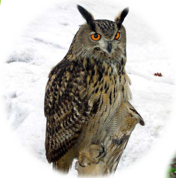
Bubo bubo (Buha)