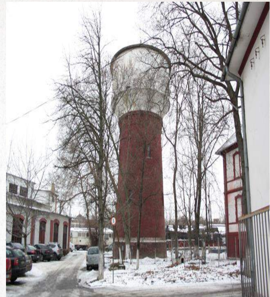
Turnul de apă al Remizei CFR