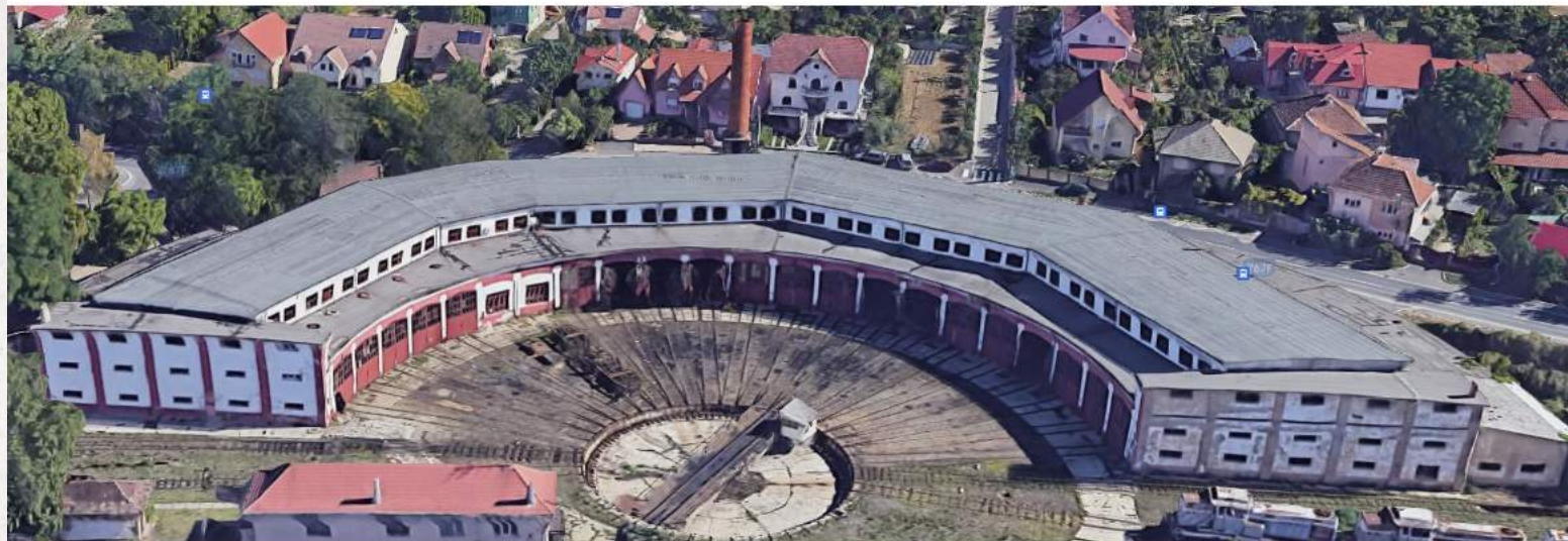
Hală de reparații locomotive și pod rotativ cu placă turnantă, funcțională și în prezent

Ansamblul Depoului CFR Stația Oradea, Str. Calea Bihorului nr. 2, compus din imobilele: 1. Hală de reparații locomotive și pod rotativ cu placă turnantă; 2. Clădirea administrativă; 3. Clădirea veche pentru dormitoare; 4. Turnul de apă. Ansamblu construit la începutul secolului XX, încă aflat în funcțiune. Proprietate a Societății Naționale de Transport Feroviar de Marfă "CFR Marfă" S.A.