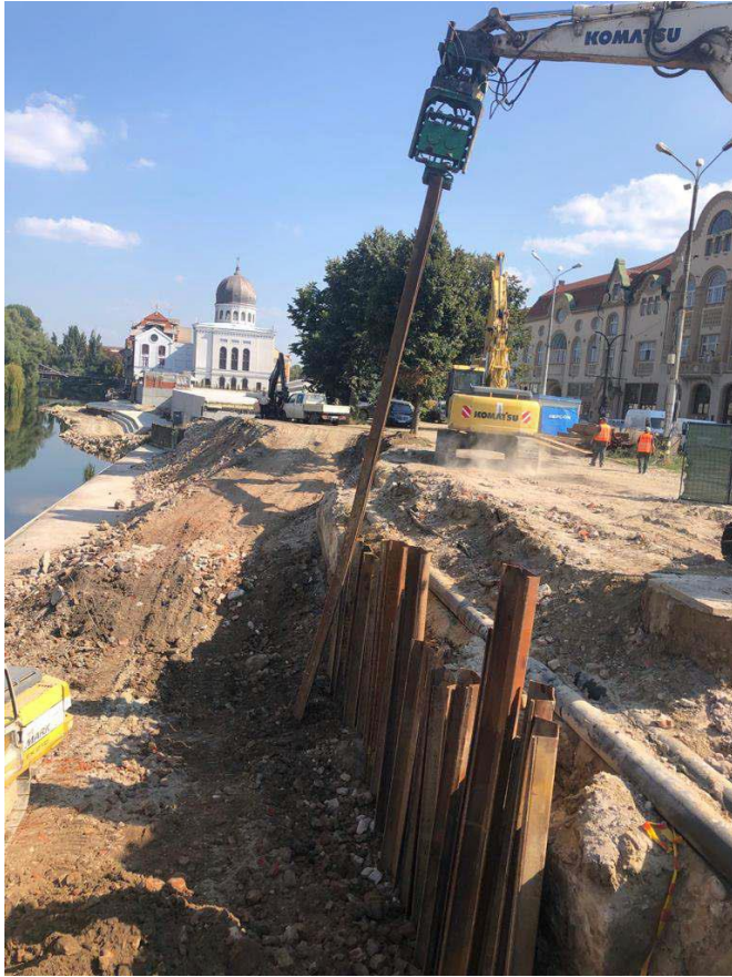
Refacerea zidului de sprijin