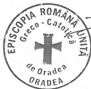
Virgil Bercea Virgil Bercea Episcop